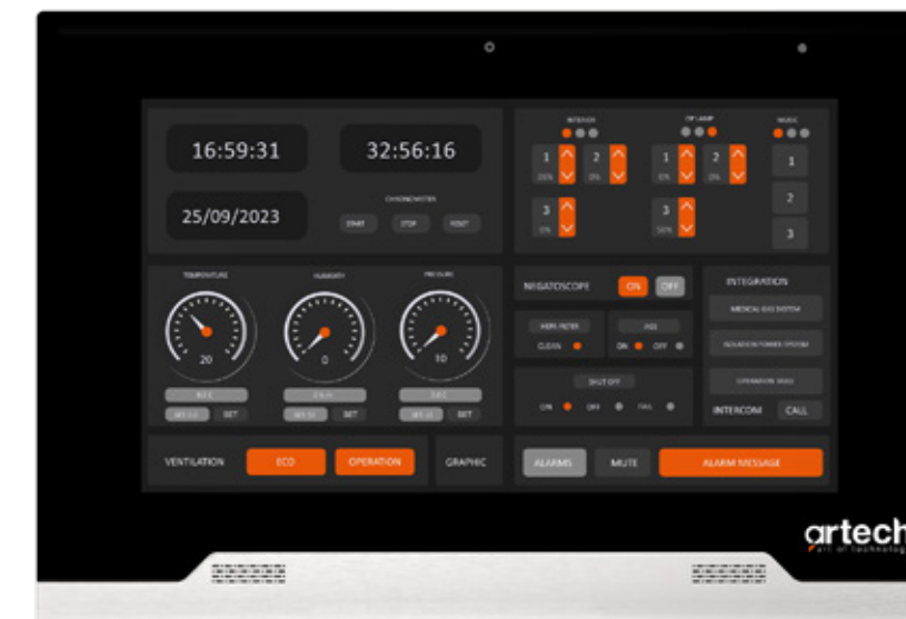
Ameliyathane Kontrol Paneli